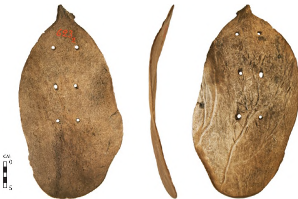
Рис. 3. Лопасть лопаты. Рог лося. Шигирский торфяник, прииск «По Истоку». МАЭ РАН.