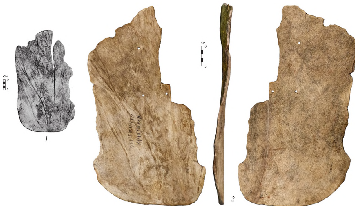
Рис. 4. Лопасть лопаты. Рог лося. Кыштымский рудник. СОКМ. 1 — предмет из работы В.Я. Толмачева, фото; 2 — современное состояние предмета, фото М.Г. Жилина

Fig. 4. A shovel blade. Elk antler. Kyshtym mine. Sverdlovsk Regional Museum of Local Lore. 1 — the item from the article by V.Ya. Tolmachev, photo; 2 — modern state of the artefact, photo by M.G. Zhilin.