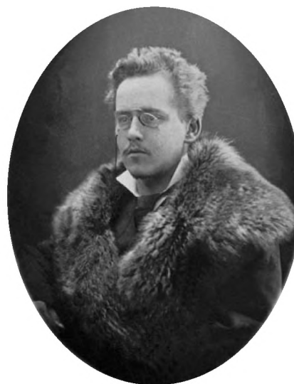
Михаил Викторович Малахов (1856–1885) Mikhail Viktorovich Malakhov (1856–1885)

Приблизительно в середине XIX в. на территории торфяника, входившего в состав possessions-