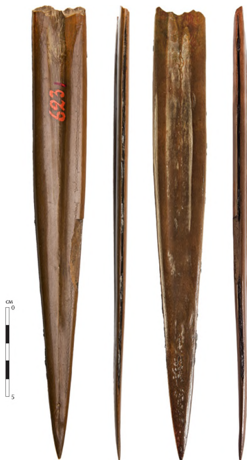
Рис. 1. Кинжал. Кость, кремнь. Шигирский торфяник, прииск «По Истоку». МАЭ РАН.

Fig. 1. A dagger. Bone, chert. The Shigir peat bog, mine "Along the Source". MAE RAS.